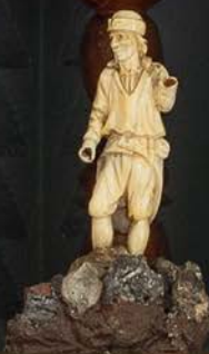
Ein Bergmann von Helfenbein auf einigen Silberstufen