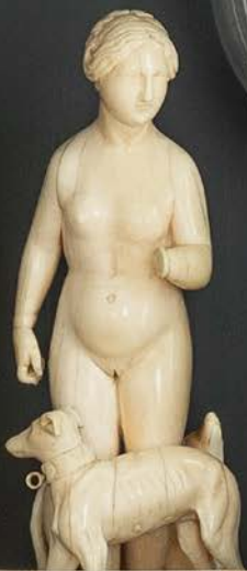
Jagd v bein, von Lyck gemacht