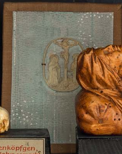
Stenköpfen , r Natur gemacht, elben Bernstein