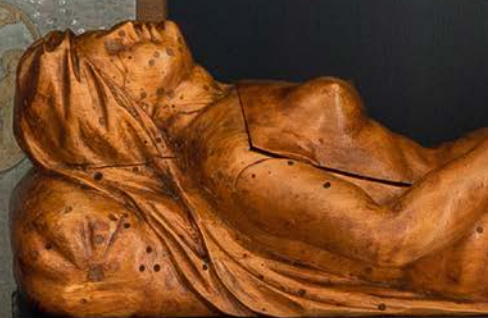
Eine liegende hölzerne von einem sehr guten M die Anatomie einer schwa